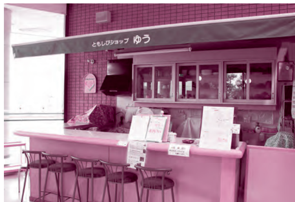
大井町保健福祉センター 1Fです