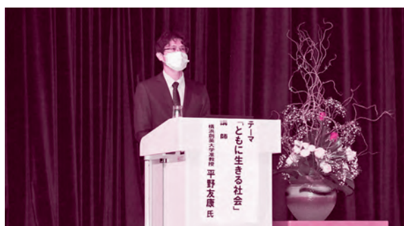
福祉みんなのつどい 講演会