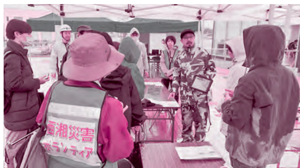
災害ボランティアセンターの設置・運営訓練の様子

■元日に発生した能登半島地震への支援を目的に、義援金の募集を行うとともに「北陸地方物産展」を開催し離れていても出来る支援を行いました。売り上げと寄附金を石川県中能登町社会福祉協議会へ全額寄附しました。