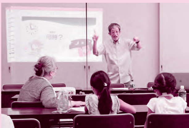
以前の手話入門講座の様子

実践形式の講習会で手話を学んでみませんか？手話を言語として、日常生活や社会生活を営んでいる当事者の方（ろう者）を講師に迎え、コミュニケーションを通じて実践的に手話を学びます。手話をはじめて学ぶ方、興味のある方等ご参加ください。