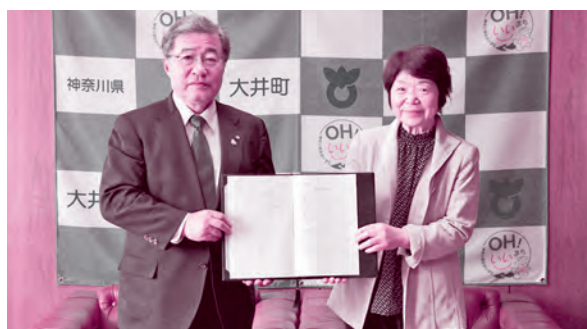
「災害ボランティアセンターの設置・運営に関する協定書」を改定