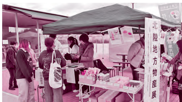
おい中央公園で開催した「北陸地方物産展」