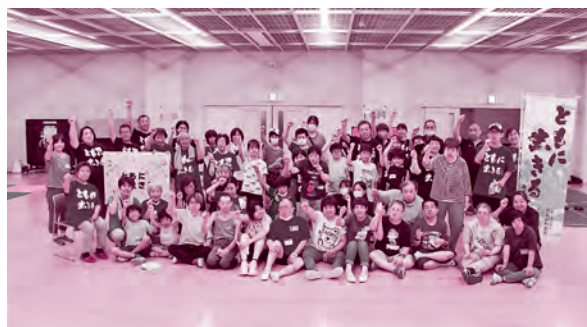
ともに生きる社会かながわ憲章啓発イベント