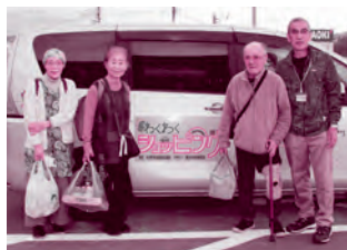
買物支援事業 (わくわく・ショッピング)

福祉作文募集、パラスポーツチャレンジセミナー、小・中学校への福祉教育の支援、ボランティア団体助成、ボランティア講座開催事業